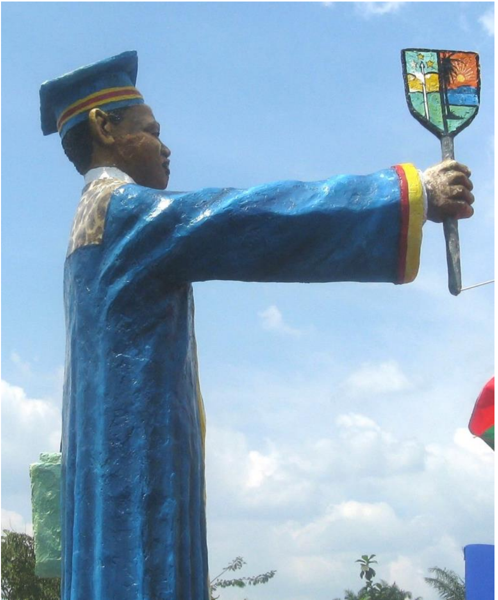
Statue d'un professeur d'université sculptée par Liyandja Soku, près du bâtiment administratif de l'université de Kisangani, UNIKIS .