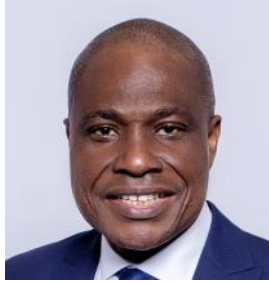
A.M. Ponyo M. Fayulu

Certains observateurs craignent que les élections ne soient de nouveau reportées, bien que la commission électorale insiste sur le fait que le calendrier sera respecté.