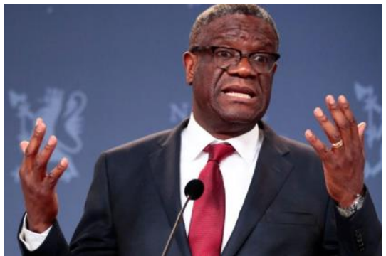
Denis Mukwege (Knack)

Denis Mukwege, l'illustre gynécologue de l'Hôpital Panzi de Bukavu, pourrait compenser son manque d'expérience politique par son image d'intégrité. Nous devons cependant immédiatement ajouter que Mukwege bénéficie de plus de prestige à l'étranger qu'au Congo.