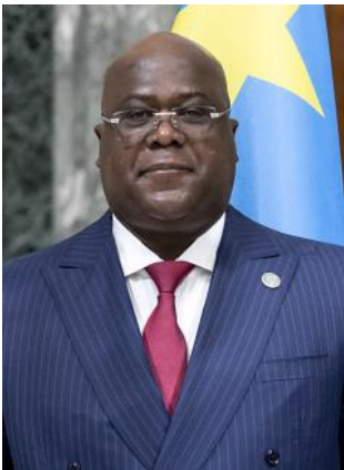
F. Tshisekedi

Une autre primeur : pour la première fois, les Congolais de l'étranger auront accès aux urnes, à condition toutefois qu'ils vivent en Afrique du Sud, en France, aux Etats-Unis, au Canada, et bien sûr en Belgique.